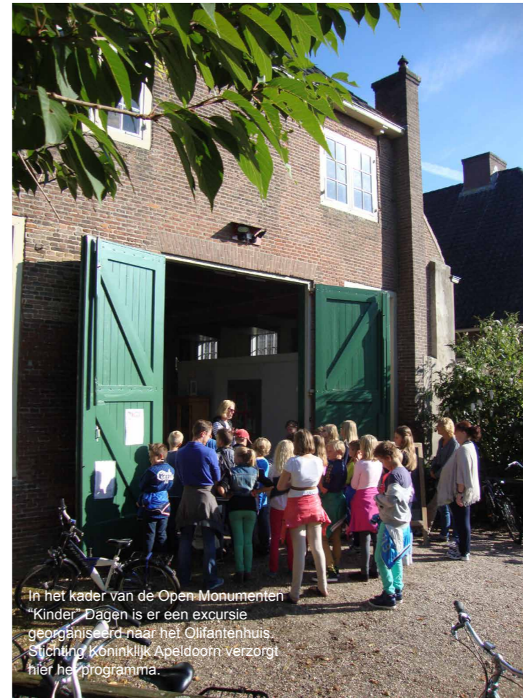
In het kader van de Open Monumenten "Kinder" Dagen is er een excursie georganiseerd naar het Olifantenhuis. Stichting Koninklijk Apeldoorn verzorgt hier het programma.