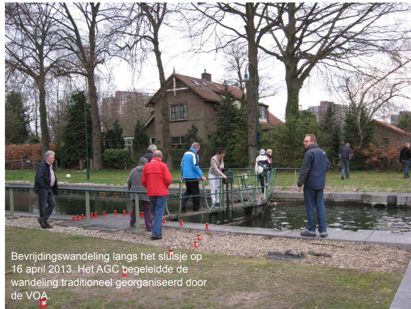
Bevrijdingswandeling langs het sluisje op 16 april 2013. Het AGC begeleidde de wandeling traditioneel georganiseerd door de VOA.