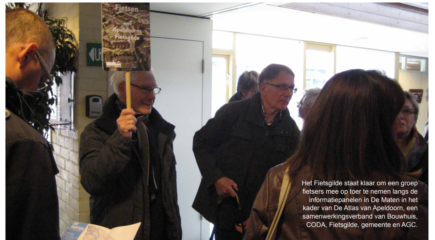
Het Fietsgilde staat klaar om een groep fietsers mee op toer te nemen langs de informatiepanelen in De Maten in het kader van De Atlas van Apeldoorn, een samenwerkingsverband van Bouwhuis, CODA, Fietsgilde, gemeente en AGC.