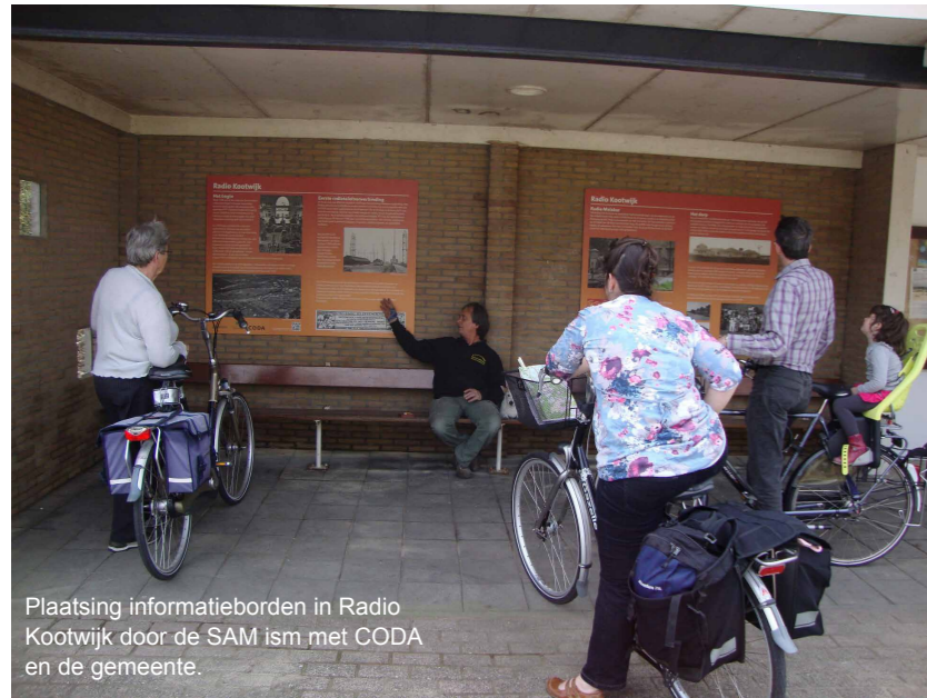
Plaatsing informatieborden in Radio Kootwijk door de SAM ism met CODA en de gemeente.