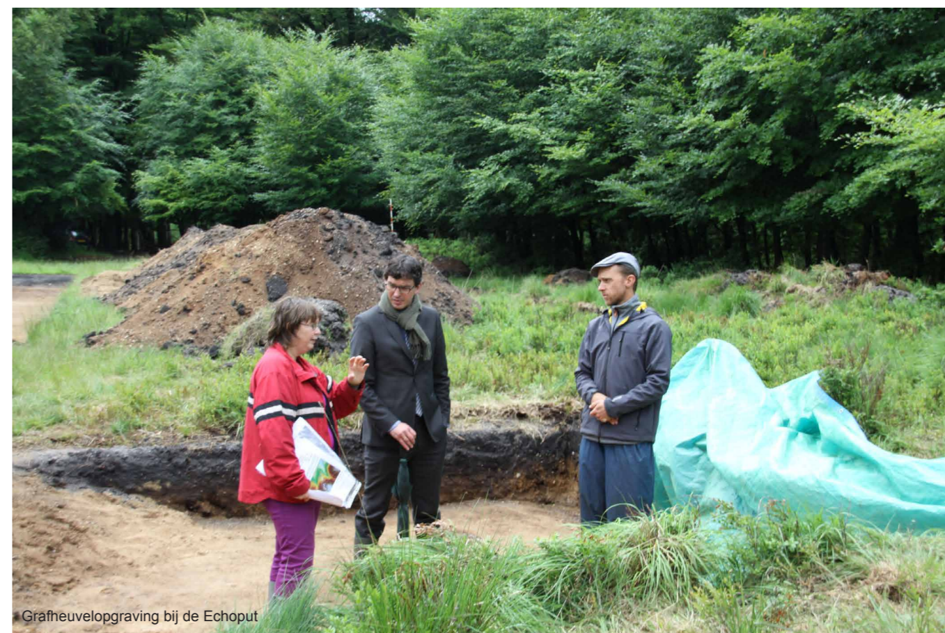
Grafheuvelopgraving bij de Echoput