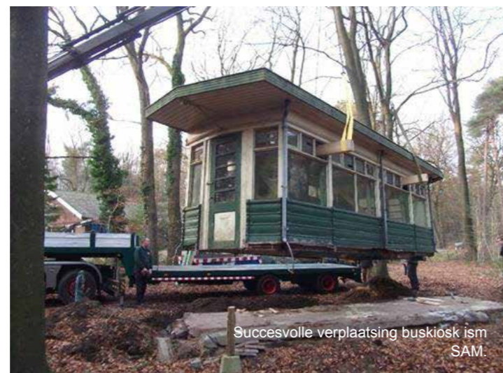
Succesvolle verplaatsing buskiosk ism SAM.