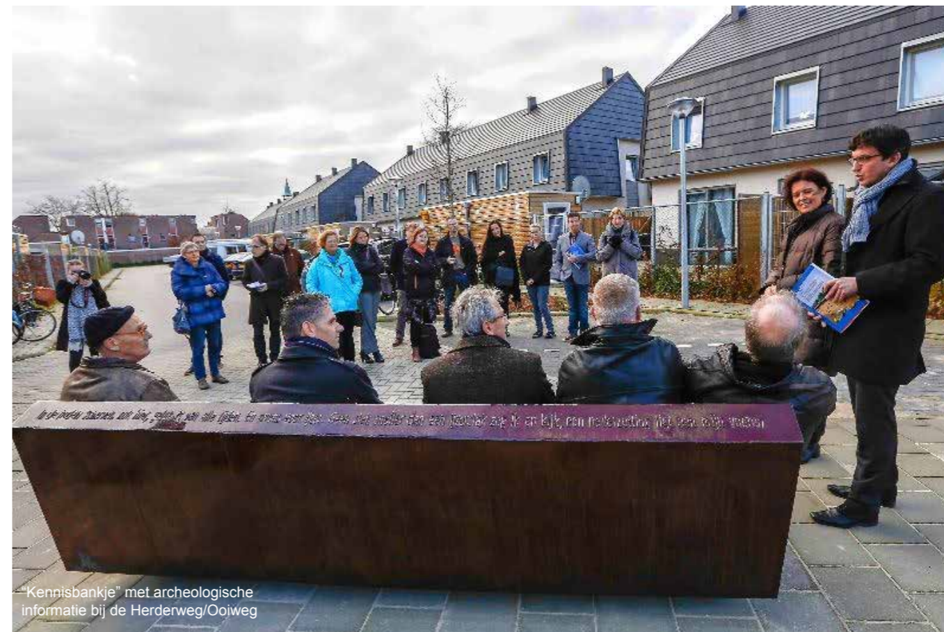
"Kennisbankje" met archeologische informatie bij de Herderweg/Ooiweg