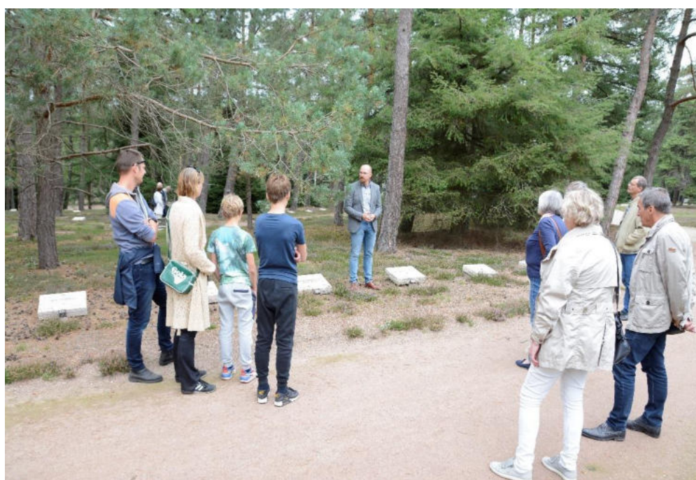
Open Monumentendagen 2020