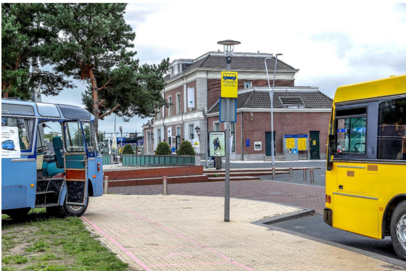
Open Monumentendagen 2020