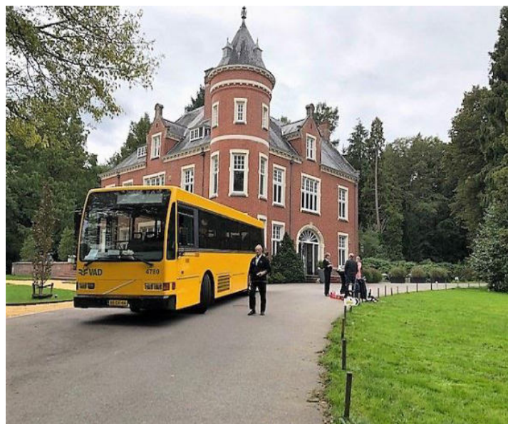
Open Monumentendagen 2020; Spelderholt

In dit jaarverslag heeft u kennis kunnen nemen van de besteding van de gelden over het jaar 2020, waarvoor door de gemeente per brief de dato 16 december 2019 een bedrag van €51.594 is toegezegd.