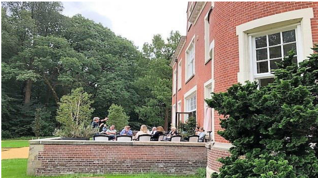
Verhalenverteller op het terras van Spelderholt tijdens de Open Monumentendagen 2020

Zoals blijkt uit de beschrijving van de doelen wordt getracht middels samenwerking tussen organisaties, werkzaam op zeer diverse terreinen, de cultuurhistorie en bouwkunst onder de aandacht van de inwoners en bezoekers van de gemeente Apeldoorn te brengen. In de hoofdstukken Activiteiten in het jaar 2020 en de Erfgoedkalender 2021 komt de grote verscheidenheid aan activiteiten naar voren en blijkt tevens dat Apeldoorn op het gebied van cultuurhistorie veel te bieden heeft.