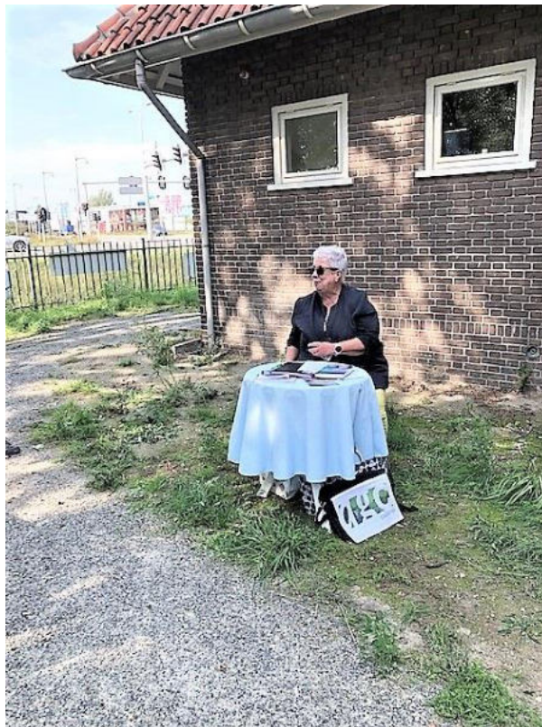
Open Monumentendagen 2020; AGC-gids bij het herinneringscentrum Apeldoornsche Bosch

Het bespreken van de concept Activiteitenkalender 2021 (zie Bijlage 6) is uitgesteld, mede vanwege het gegeven dat veel van de geplande activiteiten door de coronamaatregelen niet konden doorgaan in 2020 en deze in principe zijn doorgeschoven naar het jaar 2021. Omtrent het beschikbare budget voor 2021 zal nader overleg plaatsvinden met de gemeente Apeldoorn.