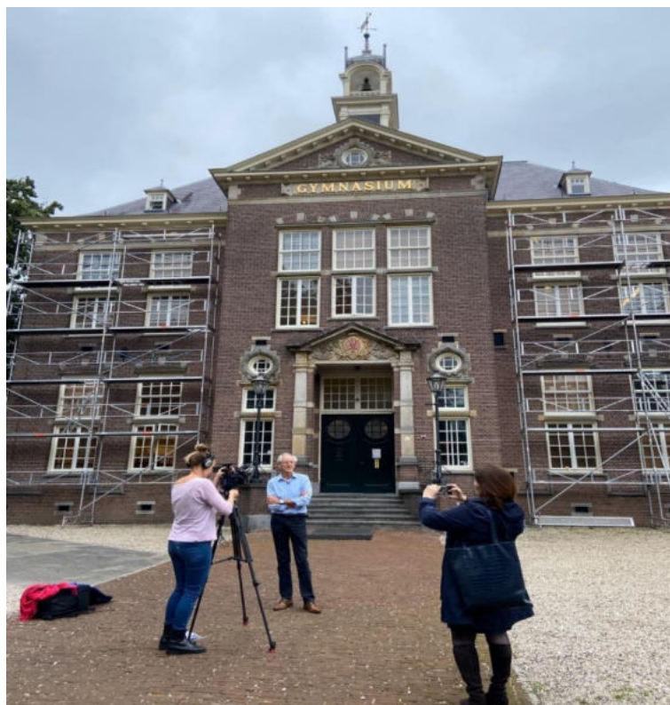
Opname voor het programma 'Goedemorgen Nederland' voor de OMD, 9 september 2020

Doelstelling is om de activiteiten van het EPA en haar aangesloten partners bij een breed publiek onder de aandacht te brengen middels het verstrekken van informatie, uitdelen van flyers en het vertonen van een diapresentatie. Tevens worden bezoekers geattendeerd op de digitale nieuwsbrief 'Ruimte voor Erfgoed', hetgeen geleid heeft tot meer nieuwe abonnees.