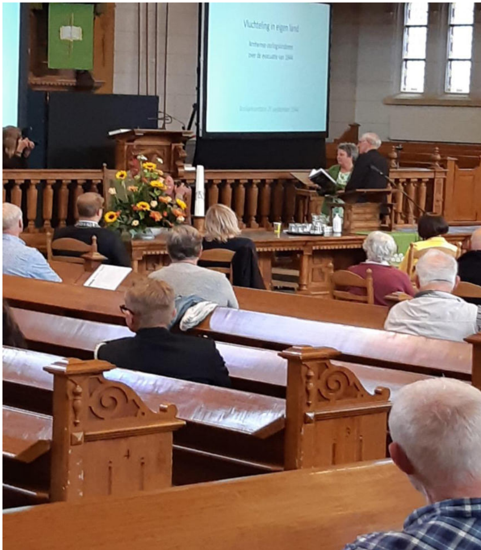
Bijeenkomst 25 september 2020 Grote Kerk van Apeldoorn; Evacuatie 1944

Over de in het jaar 2020 uitgevoerde activiteiten onder de vlag van het Erfgoedplatform treft u in Bijlage 2, aan de hand van de Erfgoedkalender 2020, een overzicht aan met vermelding van de onderwerpen en de werkelijk gemaakte kosten.