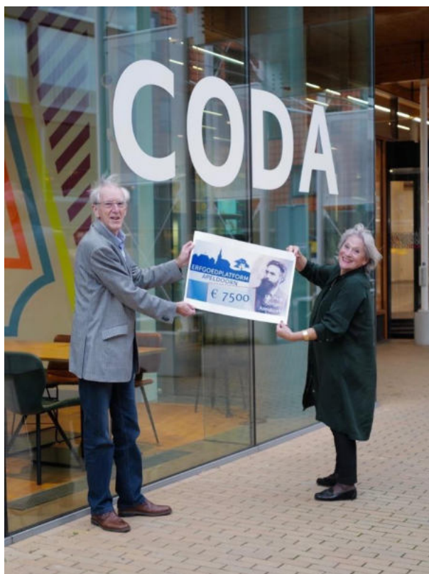
Overhandiging cheque Stichting Röntgen, 3 november 2020

3 november overhandiging cheque aan de Stichting Röntgen