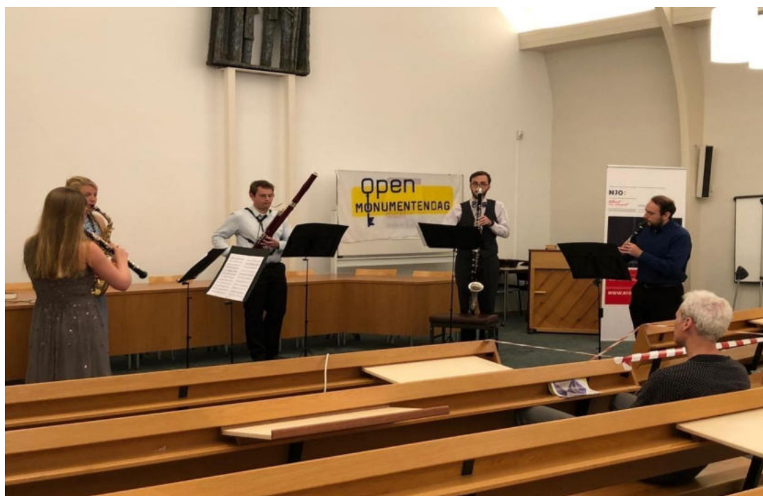
Open Monumentendagen 2020