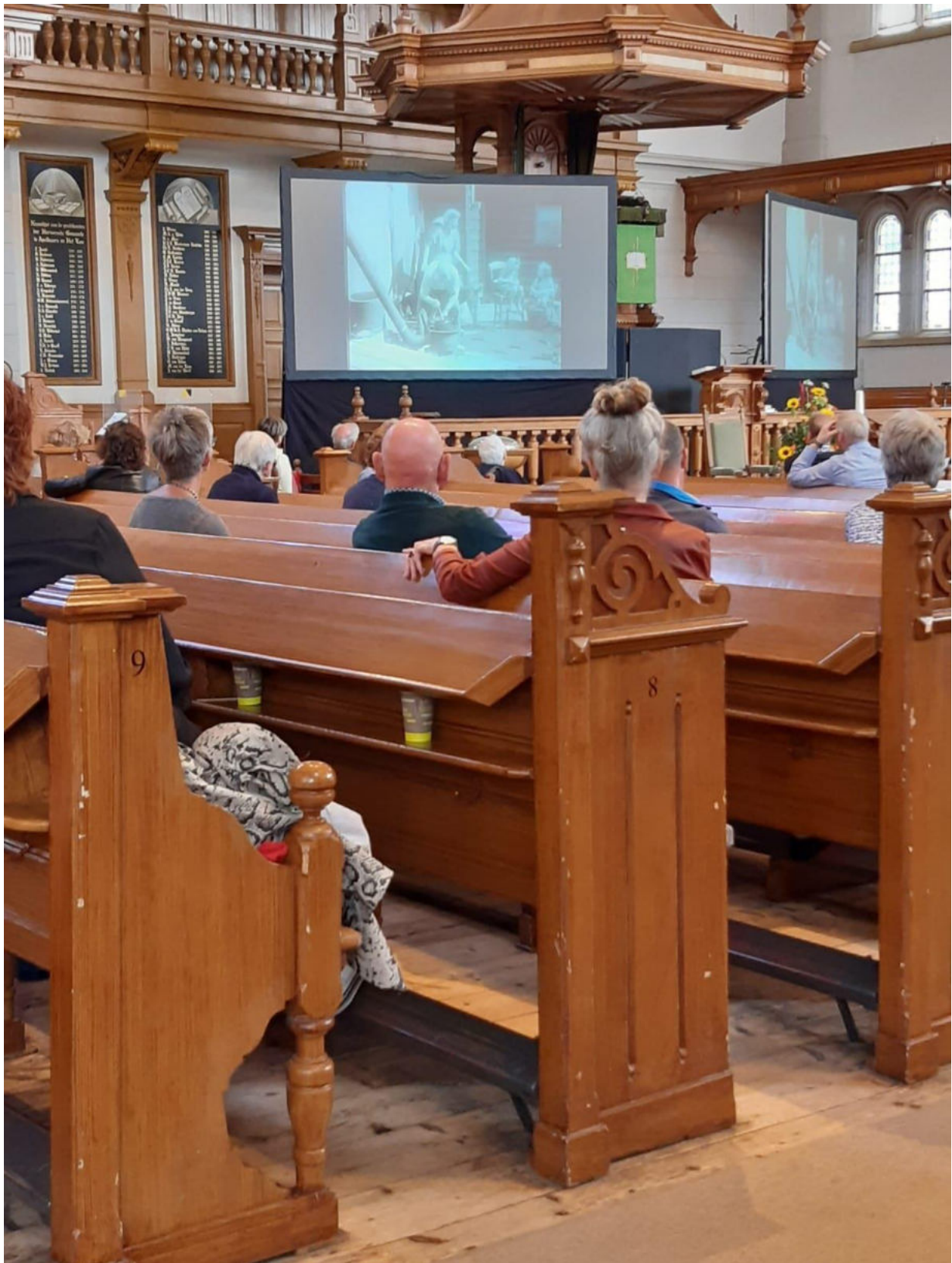
Bijeenkomst 'Evacuatie 1944 in de Grote Kerk van Apeldoorn, 25 september 2020