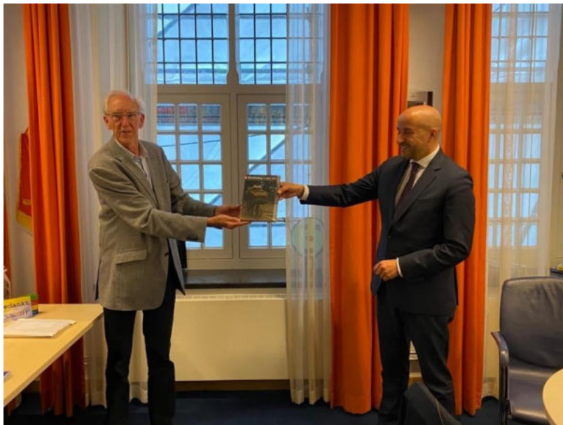
Aanbieden boek 'Vluchteling in eigen land' aan burgemeester Ahmed Marcouch, 8 oktober 2020

08 oktober overhandigen boek Vluchteling in eigen land aan burgemeester Ahmed Marcouch in Arnhem