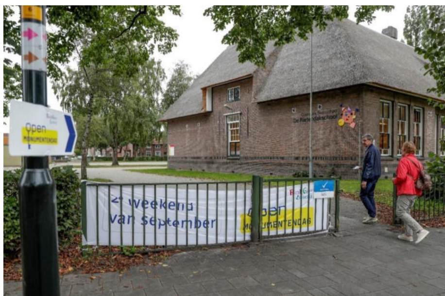
Open Monumentendagen 2020

Om een goed beeld te krijgen van de activiteiten zijn in Bijlage 5 foto's met bijbehorende tekst over de door de deelnemende organisaties uitgevoerde evenementen opgenomen. Tot slot treft u in Bijlage 6 de Erfgoedkalender 2021 aan met vermelding van de activiteiten voorzien van de door de vergadering van deelnemers toegezegde financiële bijdragen.