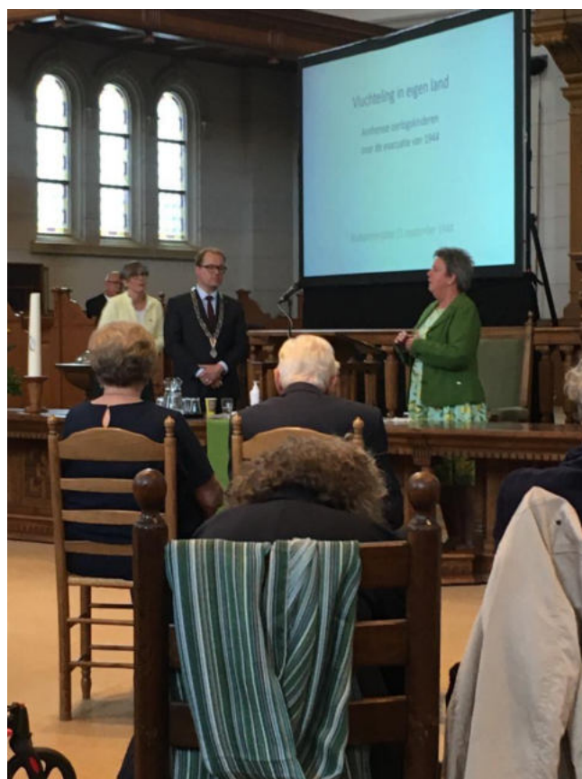
Bijeenkomst 'Evacuatie 1944' in de Grote Kerk van Apeldoorn, 25 september 2020