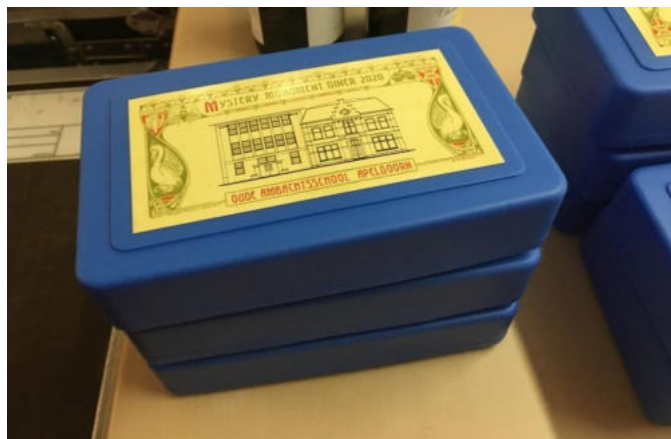
Maaltijdtrommel Mystery Monument Diner, 2020

Na de pilot in 2019 vond er ook dit jaar een Mystery Monument Diner plaats en wel vrijdag 11 en zaterdag 12 september in de Ambachtsschool. Beide avonden werden bezocht door 60 personen, verdeeld over vier lokalen en waren volledig volgeboekt. Naast een diner van 3-gangen, verzorgd door Lokaal Apeldoorn, kregen de bezoekers informatie over de geschiedenis van het schoolgebouw en de opleidingen. Medewerking werd verleend door het AGC met rondleidingen door het gebouw, het Vertelgenootschap met een verhaal over een leerling alsmede oud docenten en oud leerlingen. Het initiatief is hiervan in handen van medewerkers van de afdeling Cultuurhistorie, ondersteund door Bureau Vrijtijdswork.