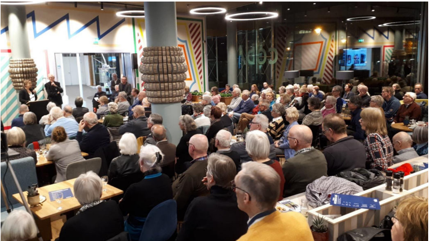
Historisch Café, 7 februari 2020

Beide sprekers gingen in op de schatten die naar voren zijn gekomen bij de imposante en zeer omvangrijke verbouwing. Dat de ontwikkelingen rond het Paleis Het Loo in de samenleving volop leven, moge blijken uit het feit dat zo'n 180 bezoekers (een record!) dit café bijwoonden.