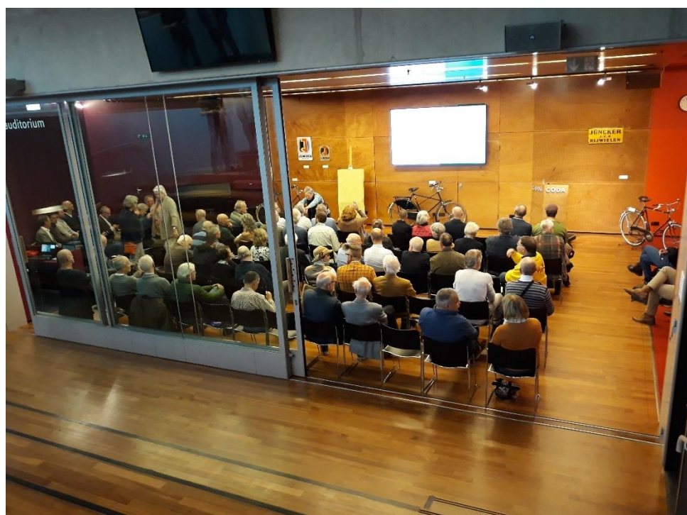
CODA Erfgoeddag, presentatie Juncker