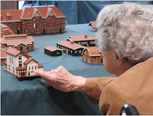
Open Monumentendagen, De Hoenderloo Groep