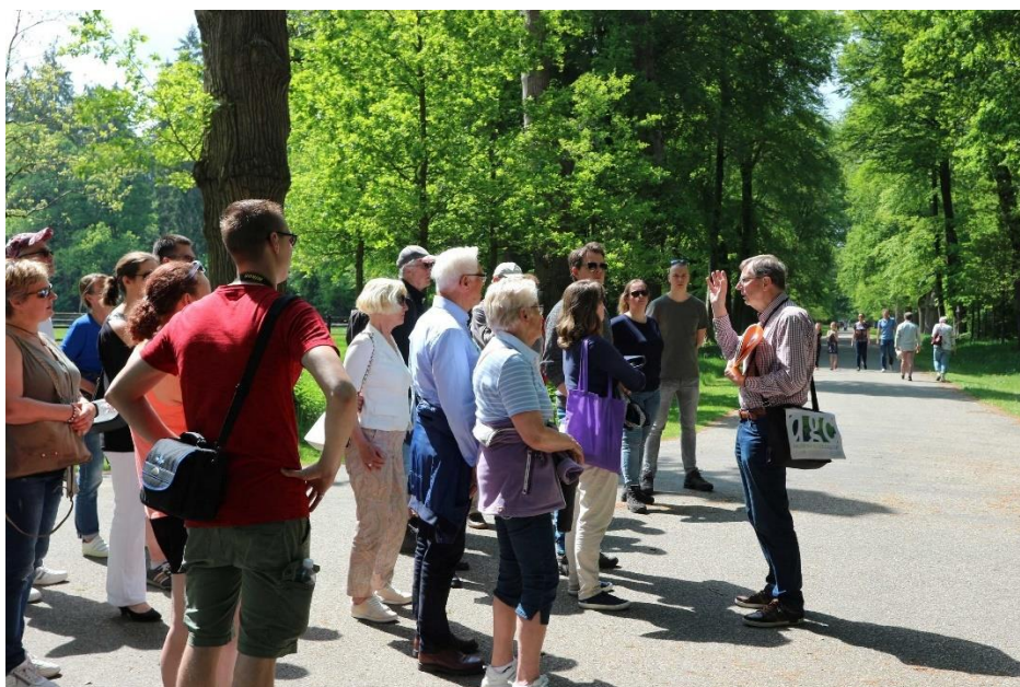
Apeldoorns Gidsen Collectief

In dit jaarverslag heeft u kennis kunnen nemen van de besteding van de gelden over het jaar 2021, waarvoor door de gemeente per brief de dato 16 december 2019 een bedrag van €50.215 is toegezegd.