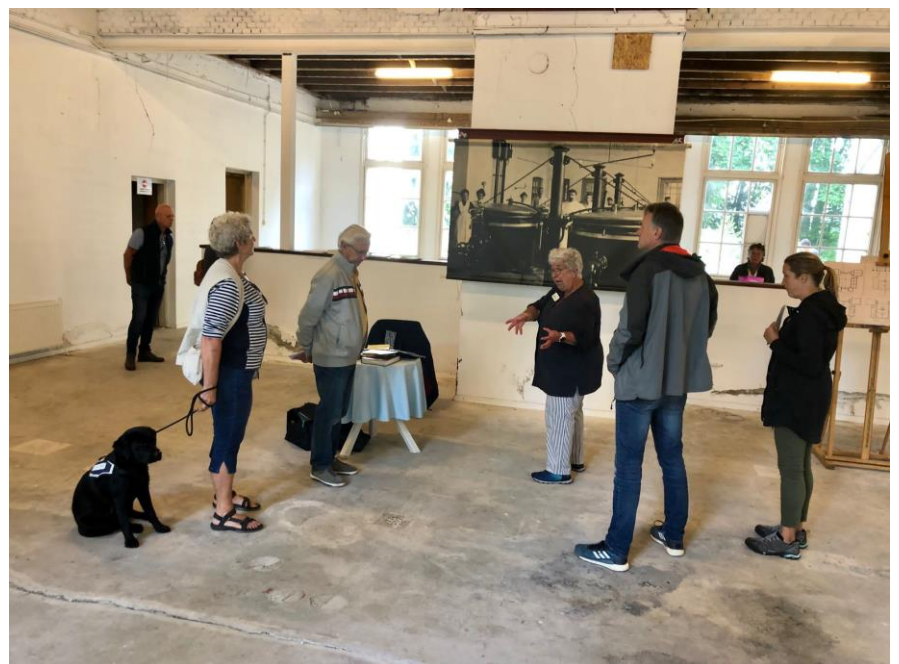
Open Monumentendagen, Het Apeldoornsche Bosch