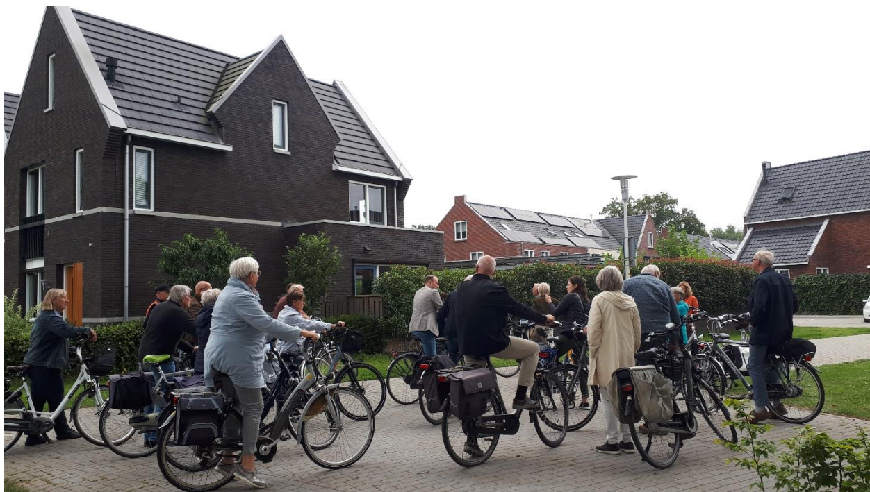
Bouwhuis Apeldoorns Architectuurcentrum, Fietstocht Groot Zonnehoeve, september