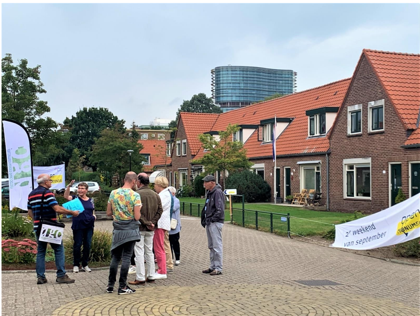
Open Monumenten Dagen, Sprengendorp, Apeldoorns Gidsen Collectief