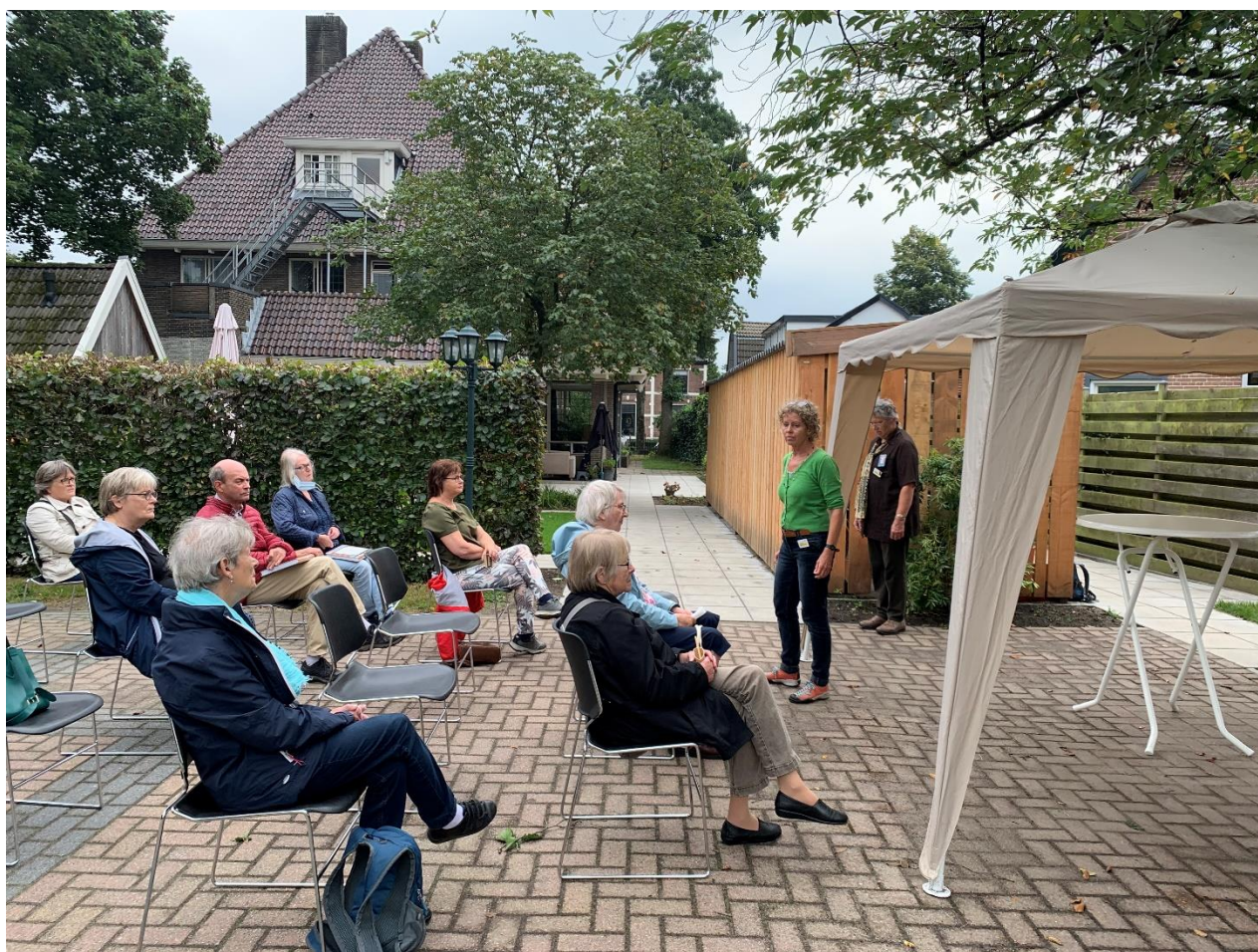
Open Monumentendagen, Het Apeldoorns Vertelgenootschap