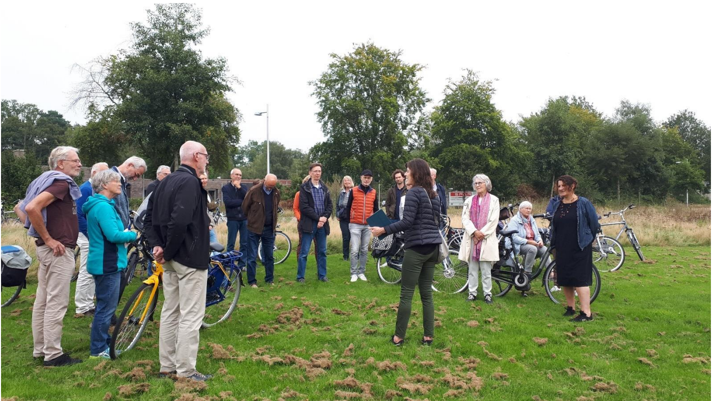
Fietstocht Groot Zonnehoeve, Bouwhuis Apeldoorns Architectuurcentrum

Zoals blijkt uit de beschrijving van de doelen wordt getracht middels samenwerking tussen organisaties, werkzaam op zeer diverse terreinen, de cultuurhistorie en bouwkunst onder de aandacht van de inwoners en bezoekers van de gemeente Apeldoorn te brengen. In de hoofdstukken Activiteiten in het jaar 2021 en de Erfgoedkalender 2022 komt de grote verscheidenheid aan activiteiten naar voren en blijkt tevens dat Apeldoorn op het gebied van cultuurhistorie veel te bieden heeft.