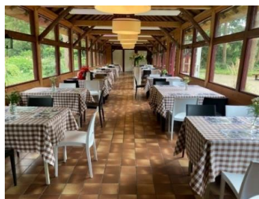
Vorbereidingen Mystery Monument Diner

Dit jaar vond er ook een zogenaamd Mystery Monument Diner plaats en vanwege het succes van de voorgaande jaren nu op drie avonden. Op 10, 11 en 12 september vond de 3 e editie plaats in het Theehuis in park Berg en Bos. Alle avonden waren uitverkocht en werden door ruim 200 personen bezocht. Naast een diner van 3-gangen kregen de bezoekers informatie over de geschiedenis van het Theehuis en het park, gevolgd door een kleine excursie rond de bosvijver. Het Vertelgenootschap verzorgde een verhaal over de totstandkoming van het park. Het initiatief voor dit evenement is afkomstig van medewerkers van de afdeling Cultuurhistorie van de gemeente Apeldoorn, ondersteund door Bureau Vrijtijdswerk.