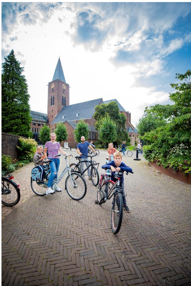
Open Monumenten Dagen, Politieacademie