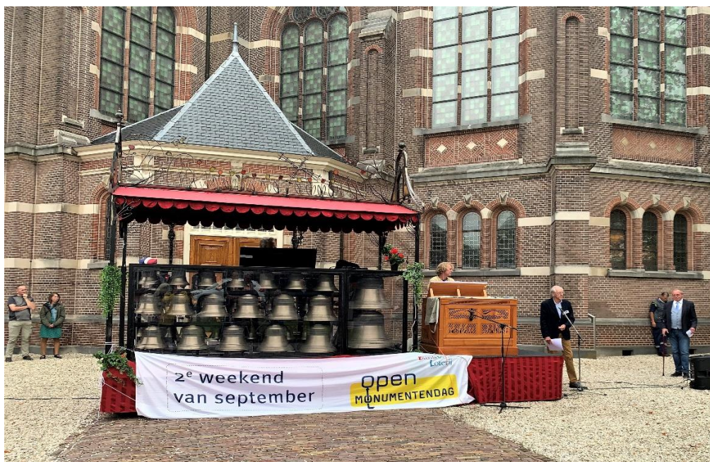
Open Monumentendagen, openingsconcert mobil carillon

Om een goed beeld te krijgen van de activiteiten zijn in Bijlage 5 foto's met bijbehorende tekst over de door de deelnemende organisaties uitgevoerde evenementen opgenomen. Tot slot treft u in Bijlage 6 de Erfgoedkalender 2022 aan met vermelding van de activiteiten voorzien van de door de vergadering van deelnemers toegezegde financiële bijdragen.